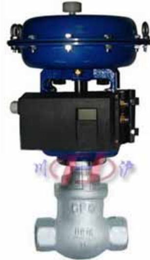
ZJSW 气动小流量调节阀 (配德国定位器)