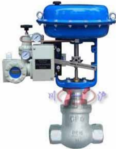
ZJSW 气动小流量调节阀 (配国产定位器)